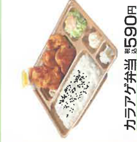
カラアゲ弁当 税込590円 スペシャルカラアゲ弁当 税込790円