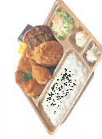
大関さん弁当 税込680円 スペシャル大関さん弁当 税込880円 ◎カラアゲ ◎カラアゲ ◎ハンバーグ