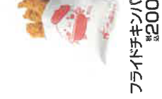
フライドポテト 税込120円 フライドチキンバー 税込200円