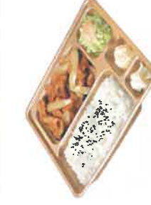
豚しょうが焼弁当 税込590円 スペシャル豚しょうが焼弁当 税込790円