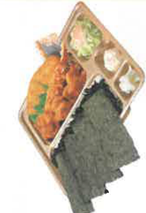
のり・カラ弁当 税込650円 スペシャルのり・カラ弁当 税込850円 ◎自身フライ