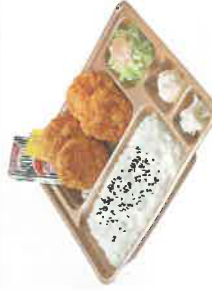
ヒレカツ弁当 税込590円 スペシャルヒレカツ弁当 税込790円