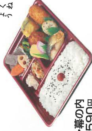
ザ・幕の内 税込590円

さば塩焼き カレールー包み揚げ れんこん入り鶏つくね きのこ入りしんじょう かぼちや天ぷら 煮物(3品) 小松菜おひたし 切干大根 厚焼き玉子 紅白かまぼこ おつけもの