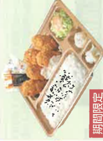
期間限定 カキフライ弁当 税込670円 スペシャルカキフライ弁当 税込870円