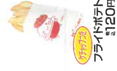
フライドポテト 税込120円 フライドチキンバー 税込200円