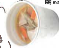
豚汁 税込150円 ※お湯はごまかせん