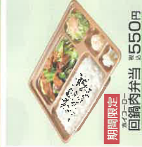
期間限定 黒カレー 回鍋肉弁当 税込550円 スペシャル回鍋肉弁当 税込750円