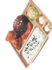
ミックスグラル弁当 税込590円 スペシャルミックスグラル弁当 税込790円 ◎ハンバーグ ◎チキンステーキ ◎ソーセージ