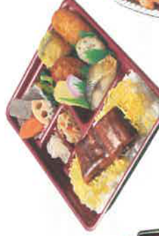
特注弁当 税込1,200円 (調理時)