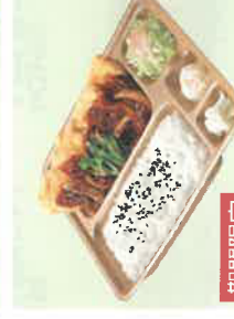
期間限定 チヤーンハン入 麻婆チキン竜田弁当 税込600円 スペシャル麻婆チキン竜田弁当 税込800円