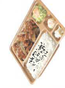
牛焼肉弁当 税込680円 スペシャル牛焼肉弁当 税込880円