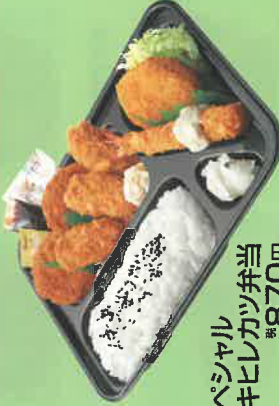
スペシャル カキヒレカツ弁当 税込870円