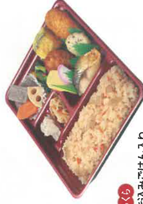
ぶっくら 炊き込みごはん入り ザ・幕の内 税込720円 炊き込みごはんのみ 税込280円