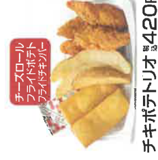
チーズロール フライドポテト フライドチキン チキポテトリオ 税込420円