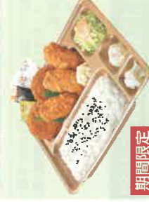
期間限定 カキヒレカツ弁当 税込670円 スペシャルカキヒレカツ弁当 税込870円 ◎カキフライ ◎カキヒレ ◎ヒレカツ ◎デブ