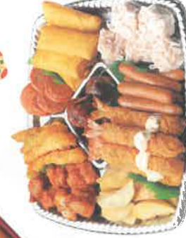
パーティープレート 税込3,000円 (調理時)