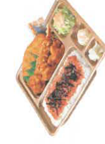
カラ・ゆんたい弁当 税込680円 スペシャルカラ・ゆんたい弁当 税込880円 ◎自身フライ