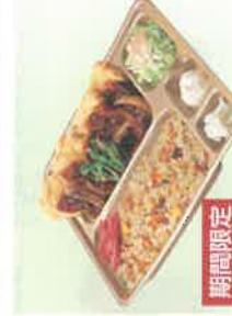
期間限定 チヤーンハン入 麻婆チキン竜田弁当 税込800円 スペシャル麻婆チキン竜田弁当 税込1,000円