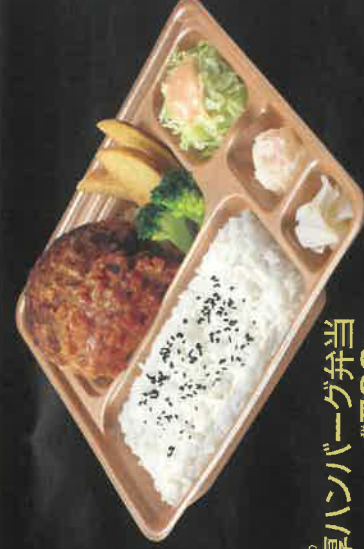
こくあつ 極厚ハンバーグ弁当 税込700円