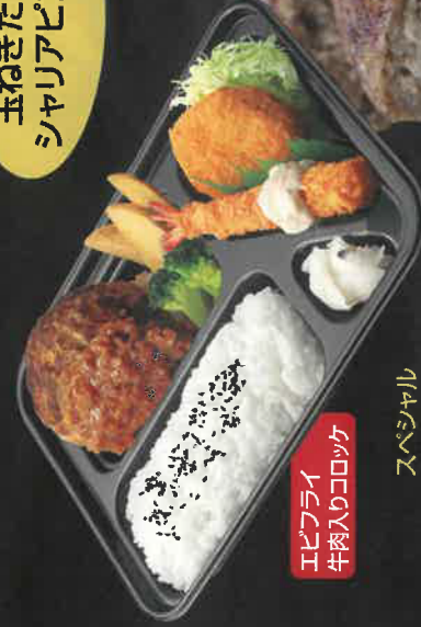
エビフライ 牛肉入りコロック