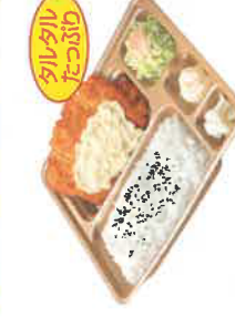
期間限定 タルタル たっぷり チキン南蛮弁当 税込600円 スペシャルチキン南蛮弁当 税込800円