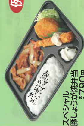
スペシャル 豚しょうが焼弁当 税込790円