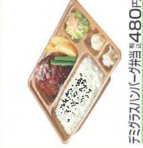
デミグラスハンバーグ弁当 税込480円 スペシャルミックスグラルハンバーグ弁当 税込680円